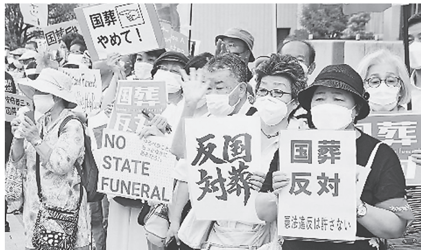
安倍元首相の国葬実施の閣議決定に抗議する人々。22日、首相官邸前

そもそも国葬を行う法的根拠が不明確です。国民の懸念に耳を貸さず、安倍氏の功績について「誠