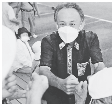
支援者とグータッチを交わす玉城デニー知事(24日、沖縄県金武町)