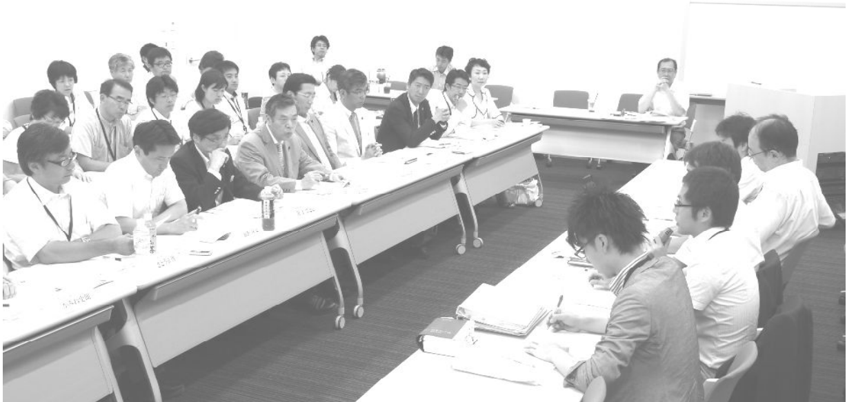
経産省と交渉する国会議員と参加者(7月17日)

今年で2回目の近畿・福井合同の原発問題の政府・電力会社交渉は、大飯原発3、4号機再稼働強行直後というタイミングで行われ、のべ78人が参加する大規模なものになった。電力消費地と立地県の日本共産党組織が住民の不安と願いに応え、原発再稼働撤回、原発ゼロ、抜本的安全対策を直接求めた意義は大きく、党の存在意義を示す重要な取り組みであった。回答は全体としてきわめて不十分なものであったが、部分的には前向きな回答もあった。参加者の確信も大きい。成果を確信にし、さらに要求と運動を強めたい。「原発ゼロの日本」へ何よりも総選挙での日本共産党の前進へ全力をあげたい。