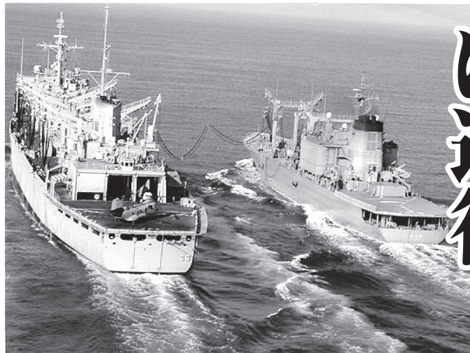
米艦艇に給油する自衛艦「はまな」(右)

新テロ特措法延長案——アフガニスタンでのアメリカの報復戦争支援を延長する法案が、憲法9条にかかわる重大問題なのに、審議2日間で衆院を通過してしまいました。アフガンの情勢は戦争開始から年々悪化し、今や最悪の状態。戦争でテロはなくせないことは、いよいよ明らかです。日本の戦争支援は、すすんでいるアフガン和平の動きに逆行するだけです。