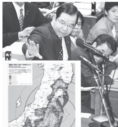
▲パネルを示して質問する志位和夫委員長＝9月27日、衆院予算委員会