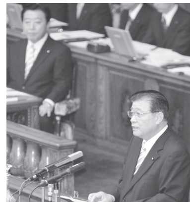
▲参院本会議で代表質問に立つ市田忠義書記局長＝9月16日