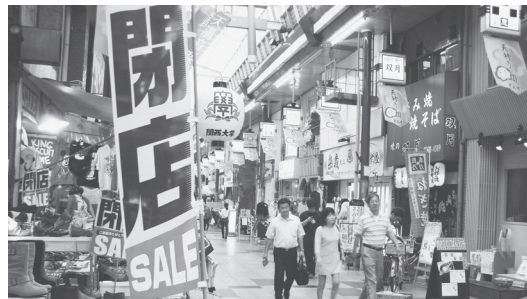
閉店セールのノボリが立つ商店街(大阪市内)

「増税分は全額、社会保障の充実にあてる」という約束もでたらめ。閣議決定された社会保障の改悪プログラム法案(骨子)