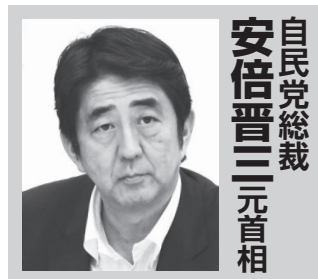
自民党総裁 安倍晋三元首相