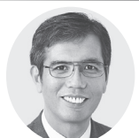
宮本 たけし 衆院議員1期