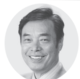
こくた 恵二 党国対委員長