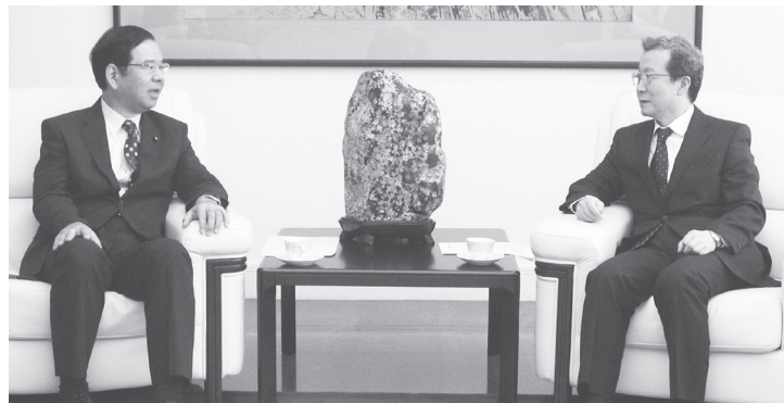
中国大使館 中国の程永華駐日大使(右)と会談する志位和夫委員長(左) 9月21日

尖閣諸島問題をどう解決するか——。日本共産党の志位和夫委員長は「外交交渉による尖閣諸島問題の解決を」との提言を発表、中国大使、野田内閣の官房長官と会談しました。