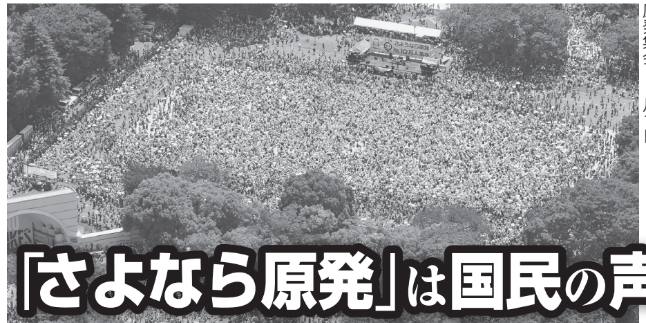
17万人が集まったさよなら原発 原発集会 7月16日