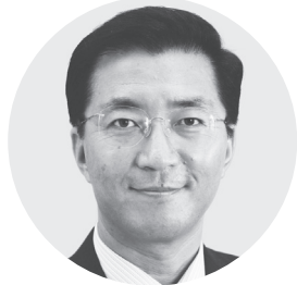
参院2期 党常任幹部会委員 山下よしき 近畿(京都を除く)