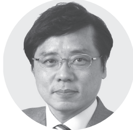
参院2期 党参院国対委員長 井上さとし 京都、東海、北陸信越

日本共産党は、今夏の参院選の比例予定候補5人を発表し、5議席をめざしてがんばっています。選挙区でも勝利をめざします。