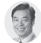
こくた 恵二 党国対委員長