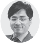
井上 哲士 (京都、東海、北陸信越) 参院議員2期