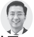
山下 芳生 (京都以外の近畿) 参院議員2期