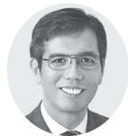
宮本 岳志 衆院議員1期