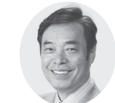
こくた 恵二 党国対委員長