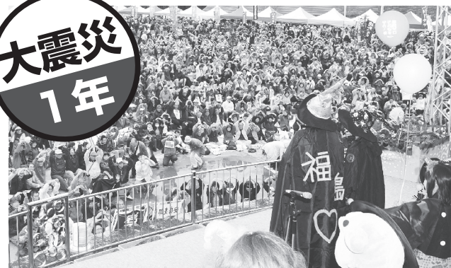
「原発なくせ」と昨年10月に開かれた福島県の1万人集会

再び大事故が起きれば、日本は壊滅的状況に。だからこそ全国各地で「原発なくせ」の声広がっています。国民のいのちと安全を守るため「原発ゼロ」を政治決断すべきです。