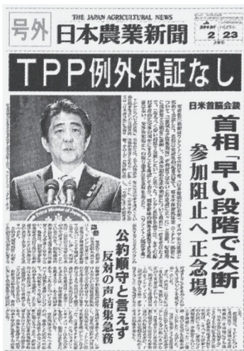
日米首脳会談を報じる日本農業新聞号外(2月23日)

日米共同声明では、すべての品目が自由化交渉の対象になり、交渉参加国がすでに合意している、「包括的で高い水準の協定を達成することも確認しています。関税および非関税障壁の撤廃をめざすというTPPの原則を認めたもので、「例外確保」というのは国民をあざむくものです。