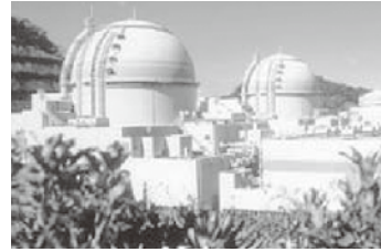
大飯原発3、4号機