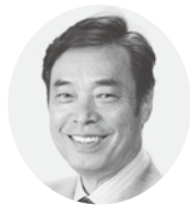
こくた 恵二 党国対委員長