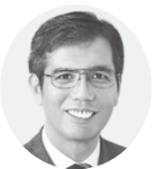
宮本 たけし 衆院議員1期