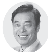
こくた 恵二 党国対委員長