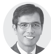
宮本 たけし 衆院議員1期