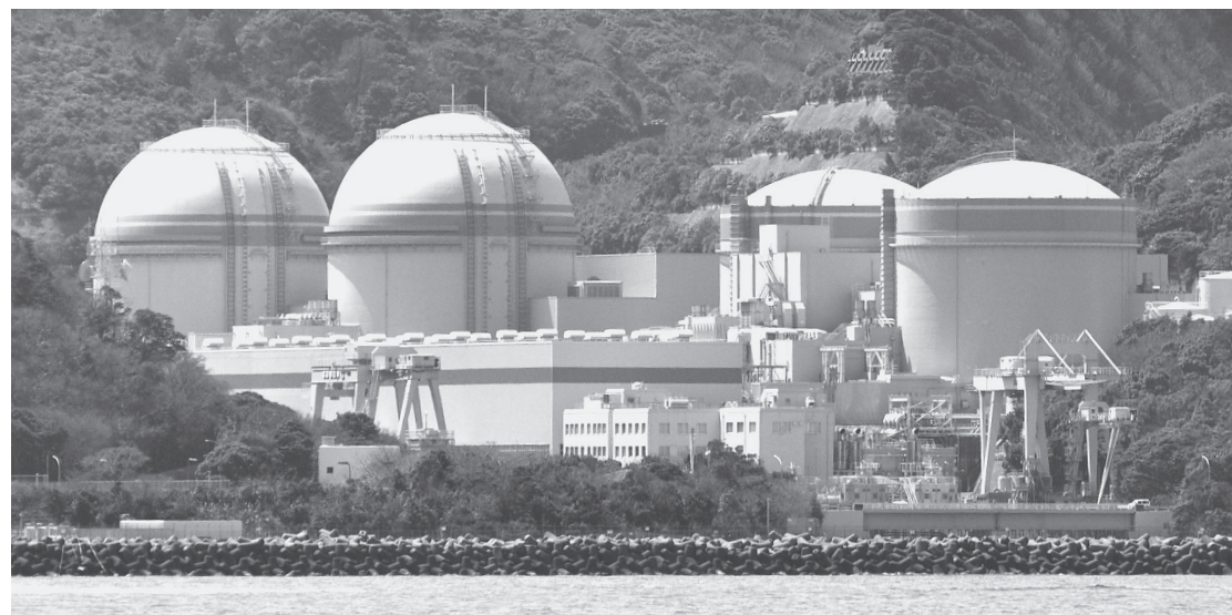
小浜湾から見た大飯原発 右から1、2、3、4号機

政府は、野田首相と関係閣僚の協議で関西電力大飯原発3、4号機（福井県おおい町）の再稼働を妥当と認め、地元説得に乗り出しました。