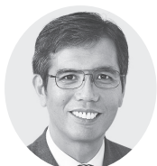
宮本 たけし 衆院議員1期