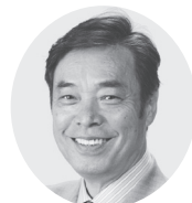
こくた 恵二 党国対委員長