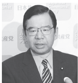
記者会見する志位氏

日本共産党は、北朝鮮の行為に対して、強く抗議する。また北朝鮮に対して、情勢を悪化させるいかなる行動も厳に慎むことを要求する。2005年9月の6カ国協議の共同声明に立ち返り、国際社会の一員として責任ある行動をとることを、求めるものである。