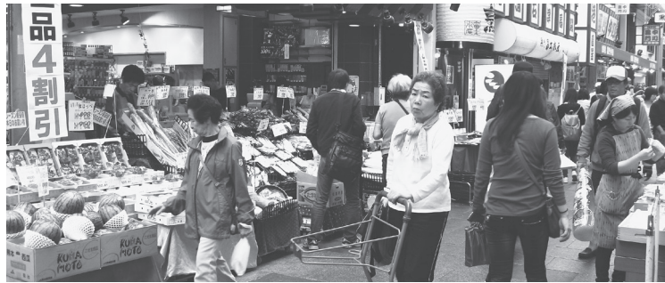
大阪市内の商店街で

② 財政政策 自民党型バラマキの復活 公共事業に10年間で200兆円つぎ込み不要不急の大型事業を推進。財政危機に陥れた「自民党型バラマキ」の復活です。