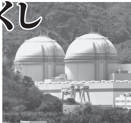
大飯原発3、4号機

原発を運転するなら、独立性の高い規制機関が最低必要です。規制庁も発足していないのに再稼働を進めるなど異常です。