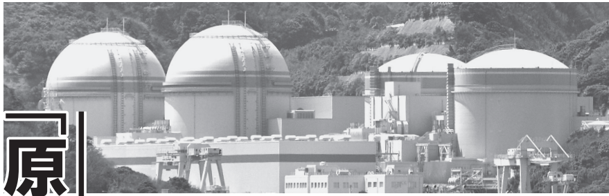
小浜湾から見た大飯原発 (右から1、2、3、4号機)