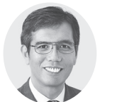
宮本 たけし 衆院議員1期