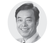
こくた 恵二 党国対委員長