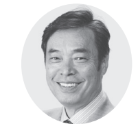
こくた 恵二 党国対委員長