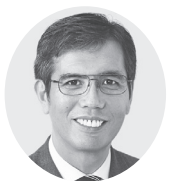
宮本 たけし 衆院議員1期