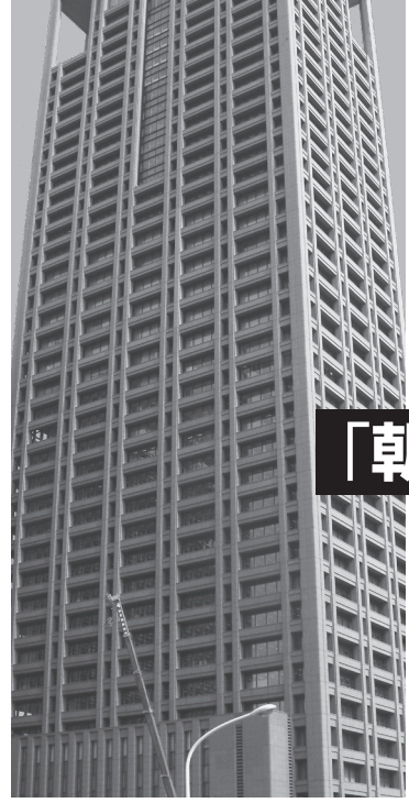
関電本店ビル(大阪市北区)