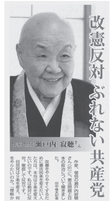
作家・僧侶 瀬戸内 寂聴さん