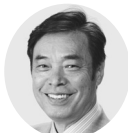
こくた 憲二 党国対委員長