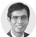
宮本 たけし 衆院議員1期