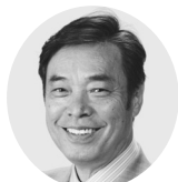
こくた 恵二 党国対委員長