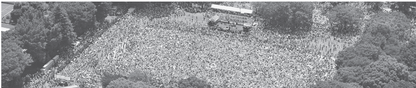
17万人が集まったさよなら原発集会 7月16日、東京・代々木公園

完全に行き詰まっている「核燃料サイクル政策」。引き続き再処理事業に取り組むとしていますが、再処理は新たな核燃料をつくり出すもの。「ゼロ」を掲げながら、再処理を続けるのは完全な矛盾です。