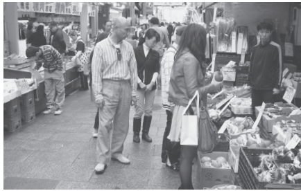
大阪市内の商店街

安倍首相は「景気はよくなった」といいますが、どんな世論調査でも国民の多数は「景気回復の実感はない」と答えています。GDP（国内総生産）のわずかな伸び