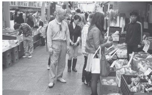
大阪市内の商店街

安倍首相は「景気はよくなった」といいますが、どんな世論調査でも国民の多数は「景気回復の実感はない」と答えています。GDP（国内総生産）のわずかな伸びを支えているのは、消費税増税前の駆け込み需要と公共事業の積み増し。肝心の働く人の賃金は18ヵ月連続でマイナスです。消費税を8%にあげると8兆円