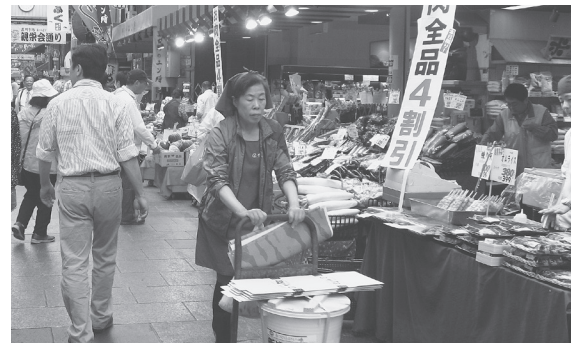
大阪市内の商店街