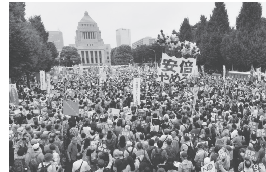
国会を取り囲み、戦争法廃案、安倍政権退陣を求める人たち 15年8月30日