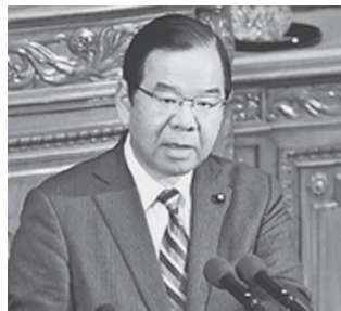
代表質問する志位和夫委員長=21日、衆院本会議

開会中の特別国会で日本共産党の志位和夫委員長（衆院議員）、山下芳生副委員長（参院議員）は衆・参院代表質問に立ち、安倍首相の姿勢をただし、日本共産党の対案を示しました。