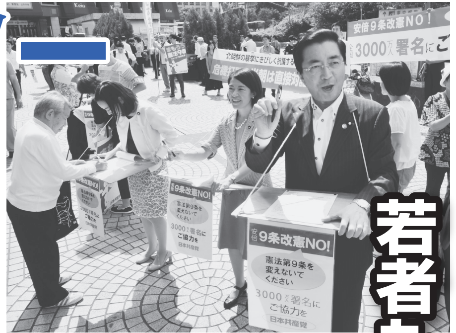
9条改憲反対の署名を訴え(右は山下よしき参院議員・党副委員長)