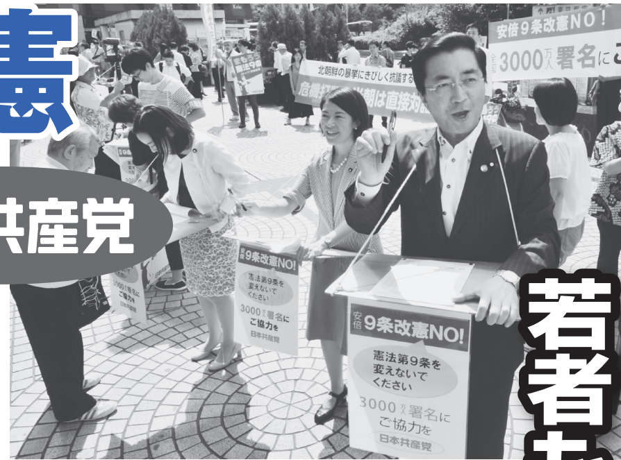
9条改憲反対の署名を訴え(右は山下よしき参院議員・党副委員長)