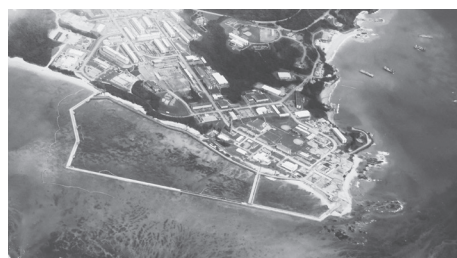
沖縄県名護市辺野古沿岸

撤回は翁長知事が生前に表明していたもの。県は行政手続きとして適正に行ったとしています。撤回理由は▽国が県との約束を反古にして工事を強行しその後も是正しない▽予定地に軟弱地盤や活断層の存在が承認後に判明したな