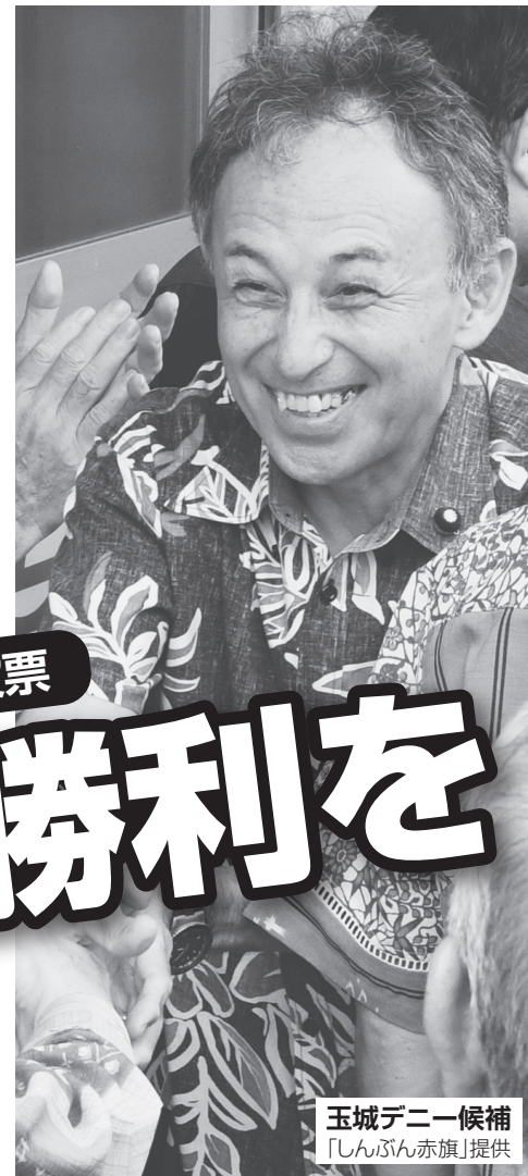
玉城デニー候補

翁長雄志知事の死去に伴う沖縄県知事選は翁長氏の遺志を継ぐ「オール沖縄」の候補・玉城デニー氏と安倍政権と自・公・維新が全面支援する佐喜真淳氏(前宜野湾市長)との一騎打ちです。辺野古の米軍新基地建設が最大争点。