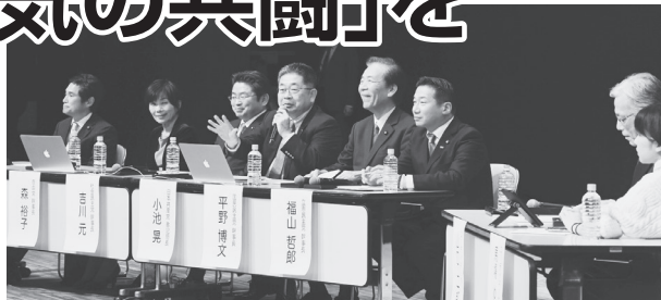
討論する6野党1会派の書記局長・幹事長 11月28日

1人区で一本化 共産、立憲、国民、自由、社民の各党と無所属の会の書記局長・幹事長が参加したシンポジウムで来年参院選の1人区での候補者一本化が確認。「本気の共闘が大事」との発言が相次ぎました。