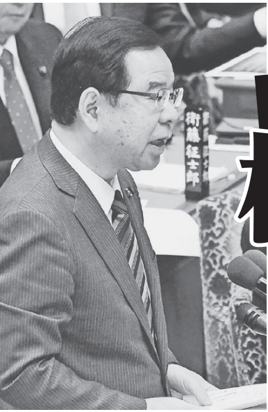
質問する志位和夫委員長 2月12日、衆院予算委員会