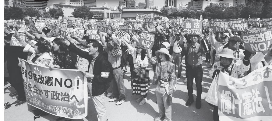
いつせいに「9条改憲NO!」のプラカードを掲げる人たち。3日、大阪市北区の扇町公園

「令和新時代」——。安倍首相は改元に便乗して「新時代」をあおっています。しかし沖縄新基地は改元をまたいでも工事が中止されるどころか、工事区域は拡大。ウソと忖度の政治も拡大しています。政治が変わらなければ「新しい時代」にはなりません。