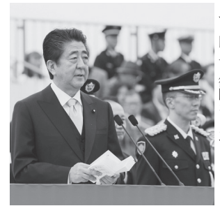
自衛隊記念日観閲式で（18年10月14日）

安倍首相が改憲の旗を振れば憲法違反になるが、安倍首相が旗を振らなければことが進まない。ここに安倍改憲の致命的弱点があります。