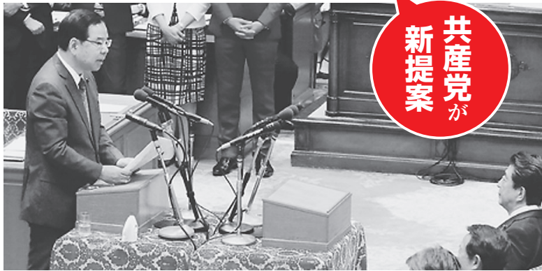
安倍首相と討論する志位和夫委員長(右) 19日、国会内