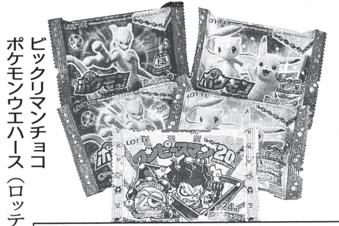
ビックリマンチョコ ポケモンウエハース(ロッテ)