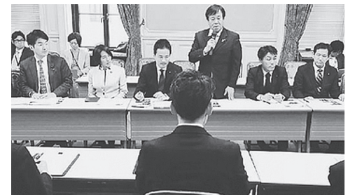
「桜を見る会」野党追及本部のヒアリング=11月27日、国会内

マルチ商法「ジャパンライフ」元会長の招待状には、総理推薦枠とみられる区分番号「60」が。当初政府は認めませんでした。野党の追及と世論に押され、11月末ついに区分番号「60」が記載さ