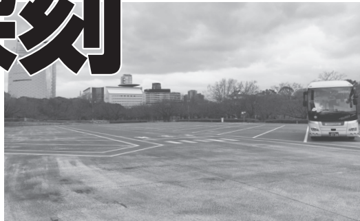
ガラガラの大阪城公園のバス駐車場

②感染の広がりによって売上げが減少している事業主などに対する雇用調整助成金は、「日中間の人の往来の急減で影響を受ける事業主」に限定されており、対象拡大を行う。