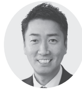
清水 ただし 衆院財務金融委員 現9期大阪4区重複