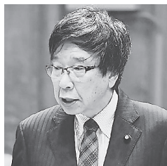
質問する大門参院議員 11日

日本共産党の大門実紀史参院議員は、1日の決算委員会で新型コロナウイルスへの経済危機対応として消費税5%への減税を求めました。