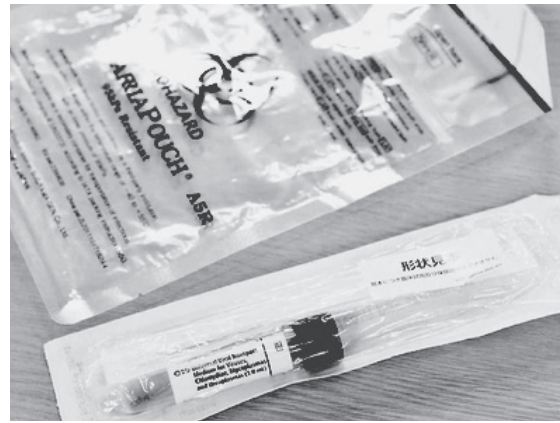
新型コロナウイルスのPCR検査で検体採取に使う綿棒、二次容器(手前)と二次容器(奥) 見本

「宣言解除」には二つの大前提が必要。①PCR検査を大幅に増やし感染の全体像を把握する—実際の感染者は少なくとも発表の「10倍以上」(西浦博北大教授)。「氷山の一角」だけで判断するのは大変危険です②医療体制のひっ迫状況を打開し、ゆとりのある体制を。