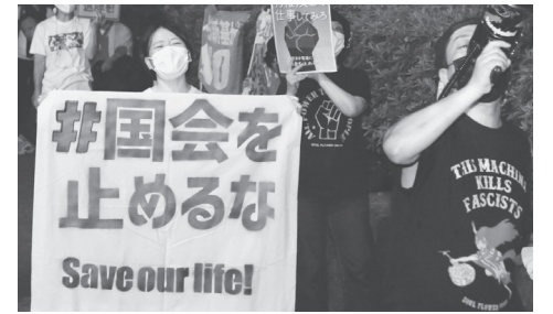
「国会止めるな」と抗議のコールをする人たち=12日、国会前

第2次補正予算が12日成立しましたが、新型コロナ感染拡大の第2波対策など議論すべき課題は山積。国会の会期末は17日ですが、国会を閉める時ではありません。