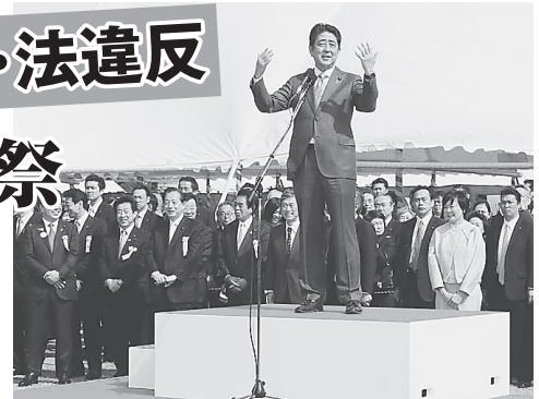
「桜を見る会」でいさよひする安倍前首相。17年4月