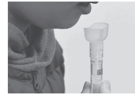
だ液によるPCR検査

政府は5日、首都圏の4都府県に発令中の緊急事態宣言を21日までの2週間延長することを決めましたが、2つの大きな問題があります。 ①なぜ2週間なのか、2週間で何をするか、中身がまったく示されていません。これでは「後手批判」をかわすための演出と言われても仕方ありません。