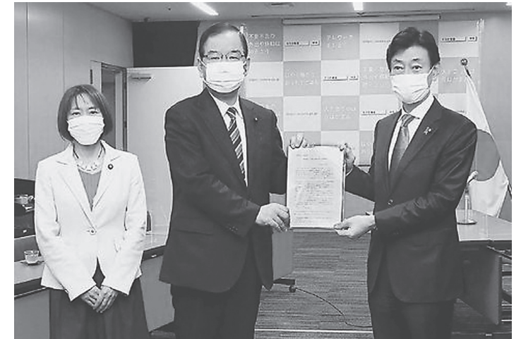
西村康稔大臣(右)に緊急要請する志位和夫委員長(中央)と田村智子政策委員長=12日、内閣府

日本共産党の志位和夫委員長は12日、菅義偉首相に対し、新型コロナウイルス感染症封じ込めのために大規模な検査を行うよう緊急に3点を要請しました。