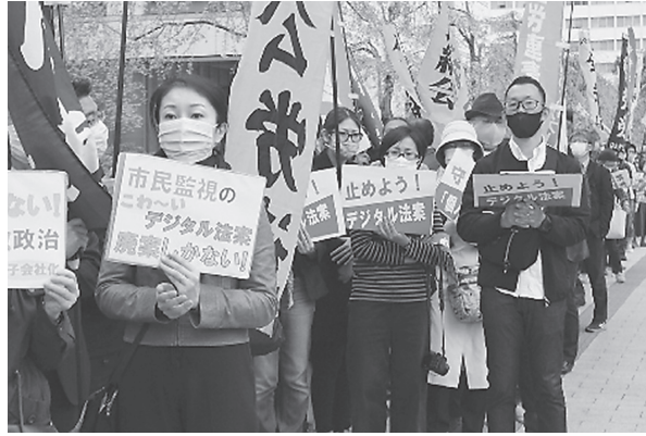
デジタル関連法案の「廃案を」と訴える人たち。2日、衆院第2議員会館前