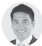
元参議院議員・新47 たつみやま たかひろ