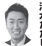
衆議院議員2期・前55 （大阪4区筆順） しみず ただし