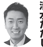
衆議院議員2期・前55 清水ただし (大阪4区筆順)